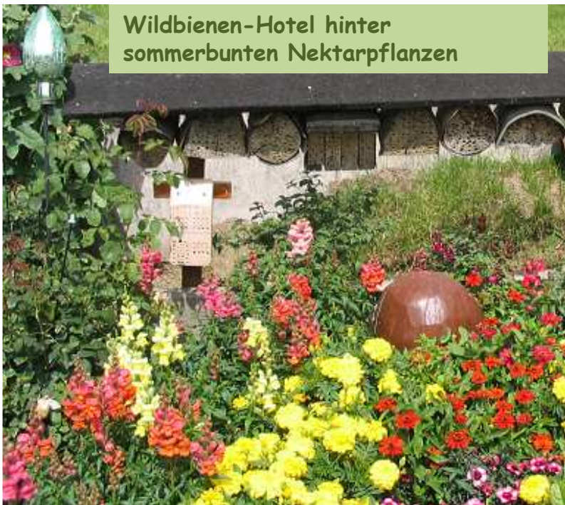
Wildbienen-Hotel hinter sommerbunten Nektarpflanzen