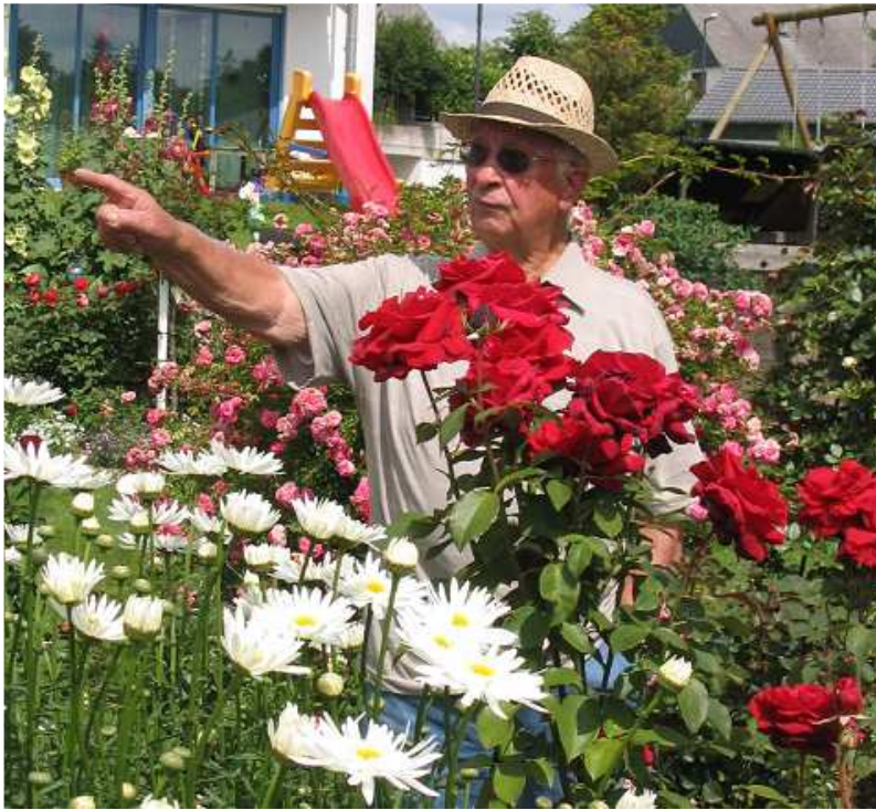
Gelungene Farbabstimmung im Rosenbeet Links: rote Rosen mit weißen Margariten rechts: prall gefüllte englische Rosen mit einfachen Stockrosen